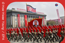
Défilé militaire annuel à la gloire de Kim Jong-un

Pays très fermé sur lui-même et le plus militarisé au monde