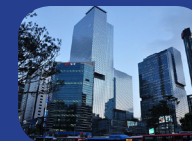
Siège social du groupe Samsung à Séoul

N°1 mondial de l'électronique pour la fabrication de télévisions, ordinateurs, téléphones portables (Samsung, LG...)